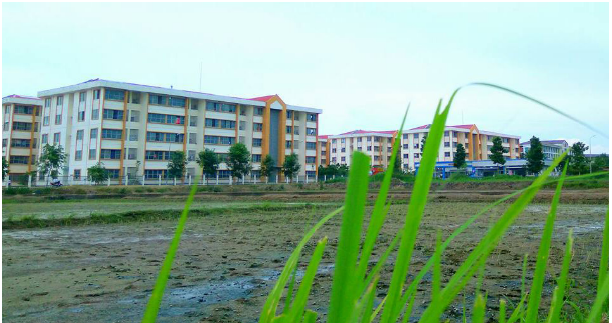
Ký túc xá Khu B, Trường ĐHCT, nguồn internet.