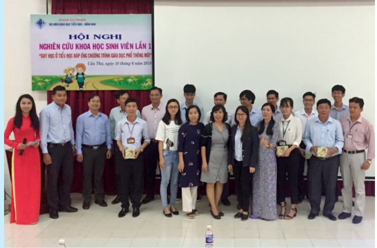
Các báo viên chụp hình lưu niệm với Ban tổ chức.

Ngày 10/6/2018, tại Khoa Sư phạm-Trường ĐHCT, Bộ môn Giáo dục Tiểu học-Mầm non đã tổ chức Hội nghị nghiên cứu khoa học (NCKH) dành cho sinh viên lần thứ nhất với chủ đề “Dạy học ở tiểu học đáp ứng chương trình giáo dục phổ thông mới”. Tham dự Hội nghị có đại diện Phòng Giáo dục tiểu học (Sở Giáo dục và Đào tạo thành phố Cần Thơ), quý thầy cô, các em sinh viên và đông đảo các em cựu sinh viên hiện đang giảng dạy tại các trường tiểu học ở thành phố Cần Thơ và các tỉnh lân cận.