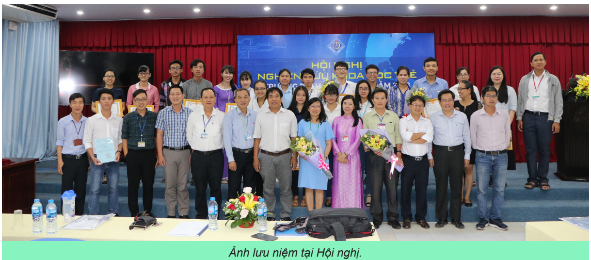
Ảnh lưu niệm tại Hội nghị.

Hội nghị đã góp phần phản ánh hiệu quả ngày càng cao của phong trào nghiên cứu khoa học trong sinh viên và giảng viên trẻ của Trường ĐHTC, từ đó, khích lệ tinh thần nghiên cứu khoa học trong cán bộ trẻ và sinh viên, khơi gợi ngày càng nhiều ý tưởng, sáng kiến mới, góp phần phát triển mạnh mẽ phong trào nghiên cứu khoa học trẻ nói riêng và nâng cao chất lượng đào tạo và NCKH của Nhà trường nói chung.