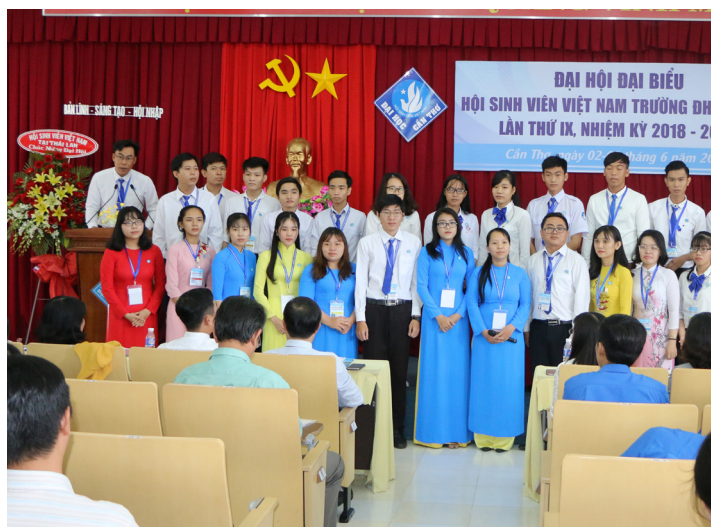
Ban Chấp hành Hội Sinh viên Trường ĐHCT khóa IX ra mắt Đại hội.

Là một trong những đơn vị xuất sắc dẫn đầu trong công tác Hội và phong trào sinh viên, Hội Sinh viên Trường ĐHCT có quyền tự hào về những kết quả đạt được trong nhiệm kỳ vừa qua, tuy nhiên, nhiều khó khăn, thách thức vẫn còn là bài toán khó đặt ra cho Hội trong việc triển khai các hoạt động, phong trào thu hút sự hưởng ứng sâu rộng, nhiệt tình từ sinh viên. Do đó, Đại hội đã lắng nghe ý kiến chỉ đạo và đóng góp xây dựng của Ban thư ký Hội Sinh