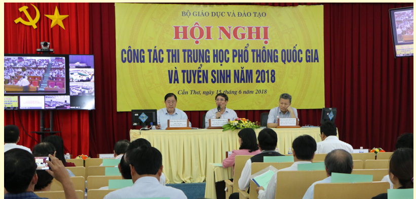
Hội nghị Công tác Thi THPT Quốc gia và Tuyển sinh năm 2018 - Điểm cầu Cần Thơ - được tổ chức tại Trường ĐHCT.

các bài thi tổ hợp, các môn/bài thi bằng hình thức trắc nghiệm (môn văn thi tự luận), mỗi thí sinh có một mã đề thi riêng.