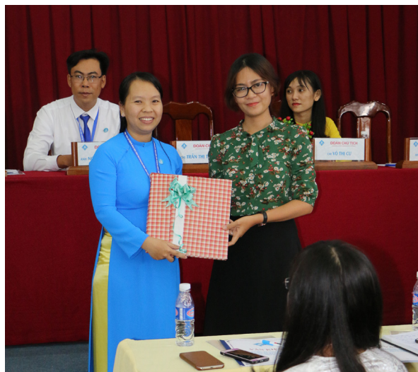
Hội Sinh viên Trường ĐHTC ân hoan đón nhận quà chúc mừng từ các đơn vị bạn.

- Sáng tạo - Hội nhập ”, Đại hội kêu gọi toàn thể cán bộ hội, hội viên, sinh viên Trường ĐHTC phát huy truyền thống vẻ vang của các thế hệ đi trước, phát huy ưu điểm, khắc phục hạn chế, yếu kém vượt qua khó khăn, thách thức; quyết tâm thực hiện thắng lợi Nghị quyết Đại hội Đại biểu Hội sinh viên Việt Nam Trường ĐHTC, nhiệm kỳ 2018-2020.